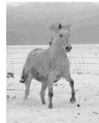
AFT interaktiv GBR

Fehrenbruch 7, 27446 Anderlingen Tel.: 04762 184587 Email: info@physio-riding.de